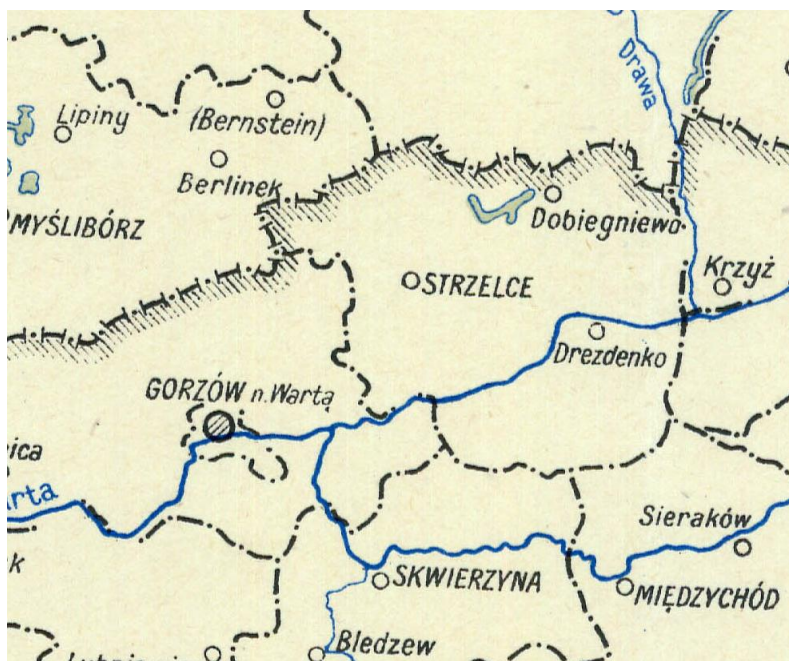
Fragment mapy administracyjnej z 1946 roku 6

Ówczesne miasta i gminy wiejskie przyjęły ustrój z okresu przedwojennego wraz z powojennymi zmianami i posiadały zagwarantowany samorząd 7 . Przed wojną w Polsce w miastach organem uchwałodawczym była rada miejska licząc w małych miastach 12 radnych, w miastach liczących od 5 do 10 tysięcy mieszkańców 16 radnych i następnie proporcjonalnie, aż do 72 radnych 8 . Według przedwojennego ustroju miejskiego organem wykonawczym był zarząd miejski z burmistrzem na czele, wybieranym przez radę miejską. Kolegium członków zarządu gminy nosiło nazwę magistratu. W skład magistratu wchodził: burmistrz, wiceburmistrz i ławnicy 9 . To właśnie burmistrz stał na czele administracji i gospodarki miejskiej. W zarządach miejskich (magistrat, urząd miasta) występowały następujące działy: ogólno-organizacyjny, finansowo-budżetowy, gospodarki miejskiej oraz administracyjny (dla spraw poruczonych przez państwo).