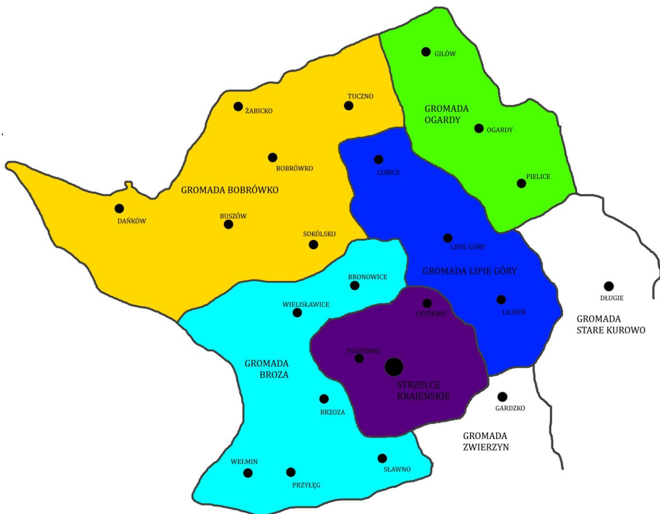
Podział na gromady w 1955 roku (opracowanie własne)