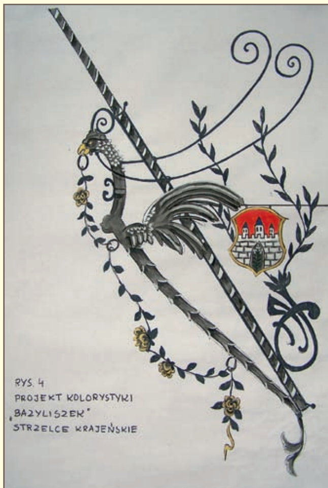
RYS. 4 PROJEKT KOLORYSTYKI „BAZYLIŚZEK” STRZELCE KRAJEŃSKIE