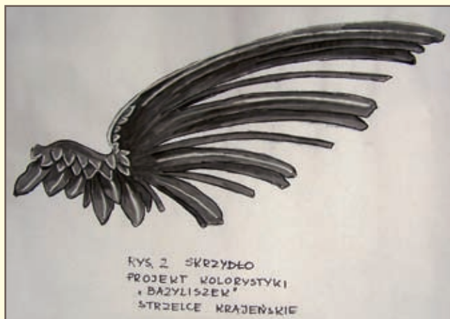
RYS. 2 SKRZYDŁO PROJEKT KOLORYSTYKI „BAZYLIŚZEK” STRZELCE KRAJEŃSKIE