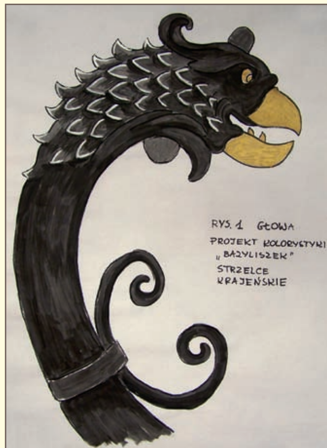
RYS. 1 GŁOWA PROJEKT KOLORYSTYKI „BAZYLIŚZEK” STRZELCE KRAJEŃSKIE