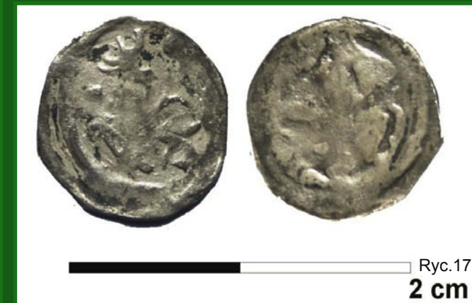
Ryc.17 2 cm

Ryc. 19. Zdjęcie lotnicze Dankowa pokazujące obecny układ miejscowości