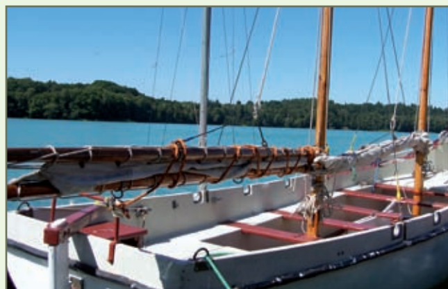
Mapa szlaków wodnych: Archiwum Lubuskiej Regionalnej Organizacji Turystycznej „LOTUR”

Wykonano na zlecenie Urzędu Miejskiego w Strzelcach Krajeńskich Aleja Wolności 48, 66-500 Strzelce Krajeńskie tel. 95 763 11 30 e-mail: urząd@strzelce.pl www.strzelce.pl