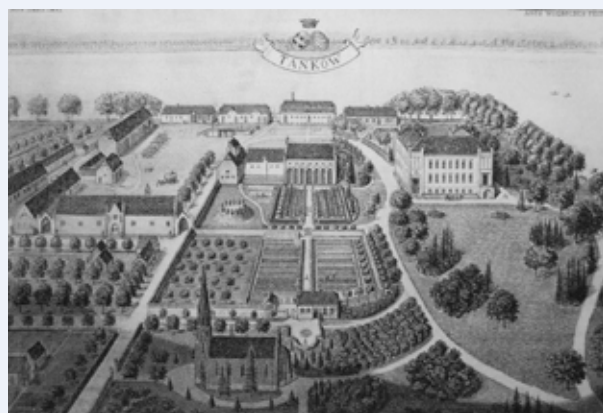
Anco Wigboldus, widok z 1937 roku

Artysta plastyk Auno Wigboldus (1900-1983) w 1937 będąc w Dankowie sporządził dwa widoki Dankowa z lotu ptaka.